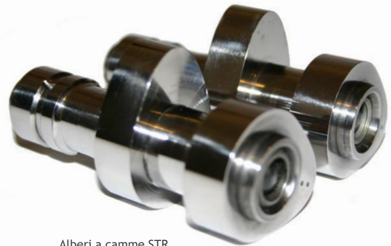
Alberi a camme STR